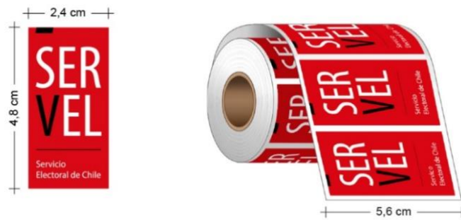
Imagen de referencia N°1

Para los actos electorales descritos anteriormente, cada rollo podrá tener entre 420, 470 o 520 sellos adhesivos, determinándose una cantidad de sellos por rollo en el caso de las Mesas Receptoras de Sufragios y eventualmente una cantidad distinta en el caso de los rollos asignados a los Locales de Votación, una vez definida la cantidad de cédulas que se utilizarán en dicho proceso.