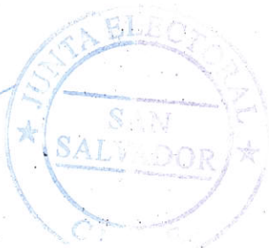
TIMBRE JUNTA ELECTORAL